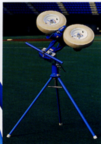
オールラウンドマシン全体