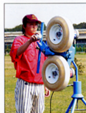
ゴロ・バウンドボール