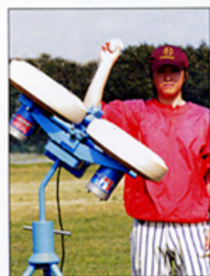
右投手のカーブ・スライダー