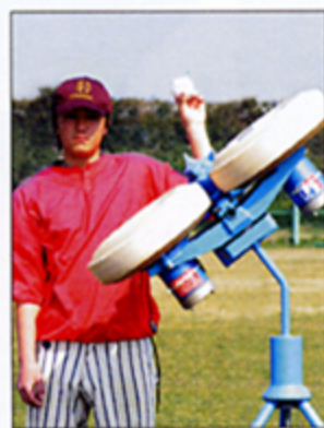
左投手のカーブ・スライダー