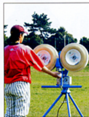
キャッチャーフライ

☆マシンを操作する時には、より安全のためにヘルメット、ゴーグルを着用してください。またスクリーンネットなどで投球者を保護するように心掛けて下さい。また、投球者は写真のように、ボールの挿入が分かるようにボールを持った手を大きく打者に見えるように差し上げてから挿入して下さい。(写真はイメージのため、ヘルメット、ゴーグルの着用はしていません)