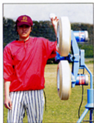
ストレート・速球